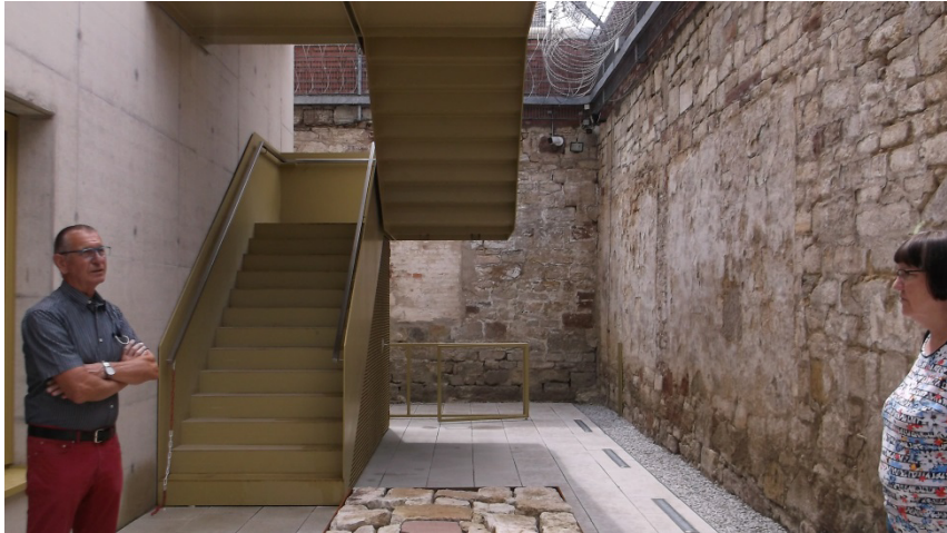
Im Kontext Neu

den ehemaligen Hinrichtungsort, der sich im Herzen der JVA befindet, zu lenken (Die Kosten des Fenster wurde mit sehr, sehr teuer beantwortet). Als Material des Dokumentationszentrums wurde ein Sichtbeton gewählt der beige eingefärbt wurde, um mit dem Sandstein in der denkmalgeschützten Gefängnismauer und dem Naturstein der umliegenden Gebäude zu harmonisieren.