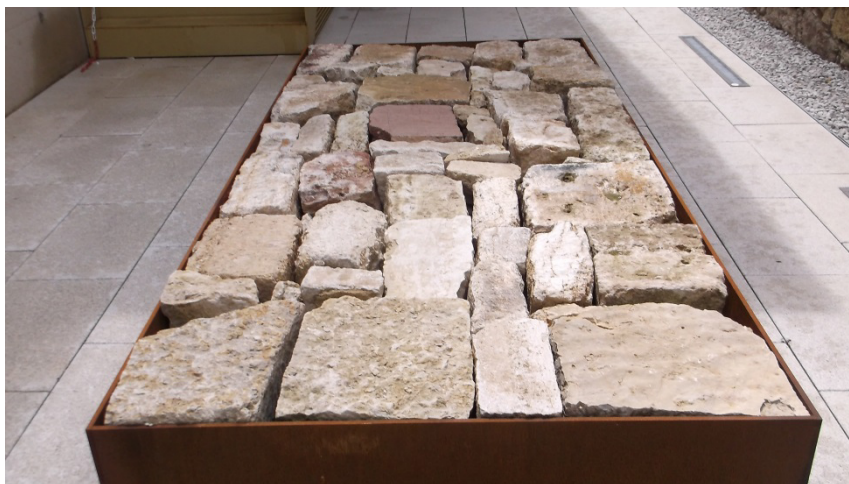
Ein Grab aus

Das Gebäude ersetzt zugleich die Gefängnismauer an dieser Stelle. Herausgebrochene Steine wurden als Skulptur in einem Rahmen zusammen gefügt (Grabgröße) oder einfach aufgeschichtet. Keiner dieser denkmalgeschützten Steine sollte verloren gehen.